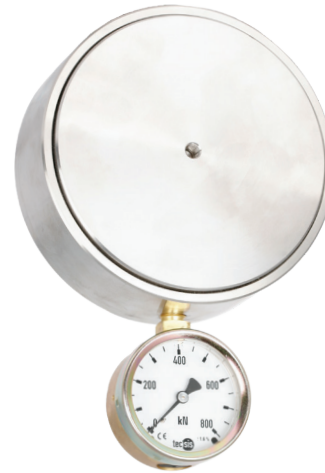
Гидравлический преобразователь силы сжатия, модель F1145

Работа гидравлических преобразователей силы основана на принципе преобразования силы, действующей на поршень, в гидравлическое давление, пропорциональное площади поршня. Оценка измеренной величины производится с помощью аналогового или цифрового измерительного прибора. Шкала показывающего прибора может быть проградуирована в различных единицах измерения (например, Н, кН, кг или т).